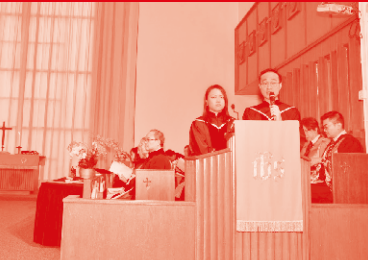
文憑、學位課程畢業生致辭 Page 10