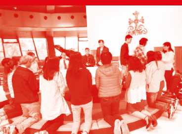
周一加油站 Page 08