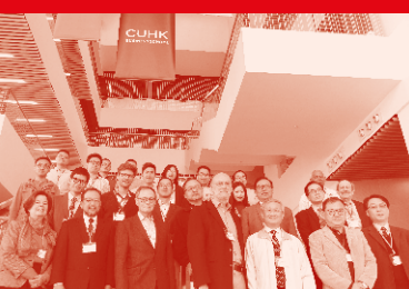
「人性、正義與社會：尼布爾與漢語學界」國際學術研討會 Page 09