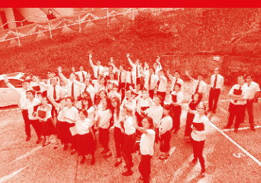
2019 神學日感恩崇拜 Page 06