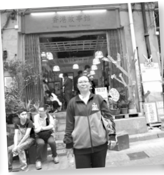
她感謝香港的朋友和同學給予她的支持和幫助。